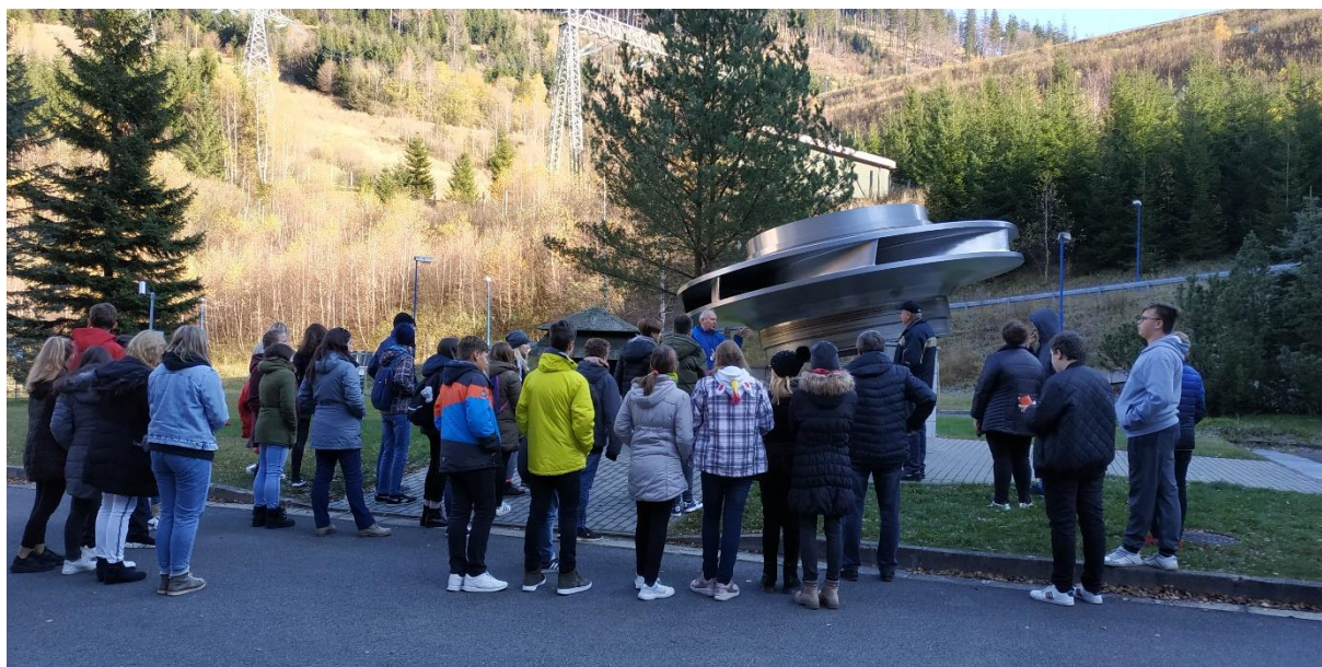
Žáci před vstupem do podzemní elektrárny

Ve čtvrtek 31.října měli naši žáci příležitost zúčastnit se vzdělávací exkurze a tím si také prodloužit podzimní prázdniny 😊. Jednalo se o exkurzi do přečerpávací vodní elektrárny Dlouhé Stráně v Koutech nad Desnou. Exkurze se zúčastnil 7., 8. a 9. ročník. Vyrazili jsme brzy ráno, jelikož nás čekala dlouhá cesta tam i zpět a tříhodinová exkurze. Na samotné místo jsme dorazili v poledne, kde si nás již převzal pan průvodce a exkurze mohla začít. Nejdříve nás průvodce pomocí projekce filmu a krátké přednášky teoreticky seznámil s fungováním elektrárny a její rozlohou a strukturou. Poté nás zavedl do podzemní elektrárny, kde jsme mohli vidět podzemní tunely, jeřáby, místo, kde se opravují samostatné části elektrárny, atd. Poté následovala prohlídka samotných nádrží. Nejdříve nás autobus zavezl k dolní nádrži, která byla právě v tu chvíli vyčerpaná a následně k horní nádrži, kde jsme měli možnost rozchodu za účelem prohlídky nádrže. V podstatě jsme měli necelou hodinu na to, abychom si horní nádrž obešli a v klidu prohlédli. Počasí nám přálo, od rána bylo příjemně slunečno, takže to byla nádherná podívaná. Po prohlídce jsme dobili energii párkem v rohlíku a teplým čajem a mohli jsme se vydat na cestu zpět. Domů jsme dorazili pozdě odpoledne a mám dojem, že si tuto exkurzi naši žáci náramně užili a že si odnesli nové vědomosti.